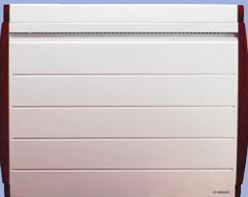
Modèle Nirvana Déco 1 000 W