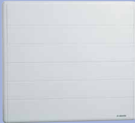
Modèle Kendo horizontal blanc 1 000 W