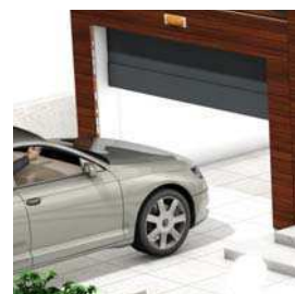
Porte de garage